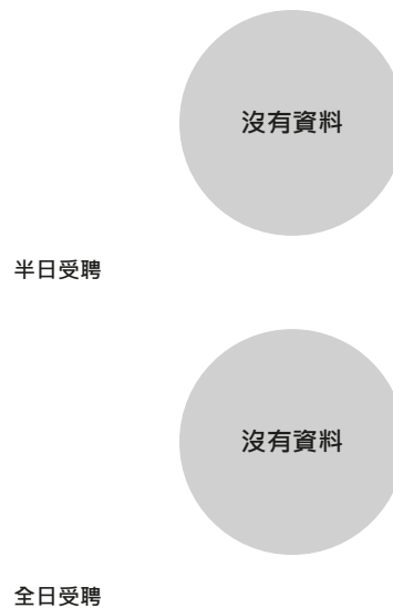
校長及教學人員幼兒教學年資 (2022年3月資料)