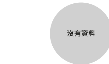
校長及教學人員幼兒教學年資 (2022年3月資料)